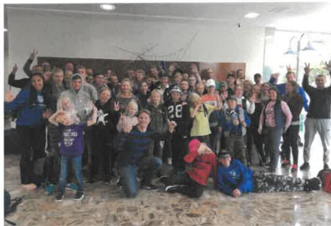
Ett glatt gäng som tränat och haft kul under klubbresan till Spanien 2018