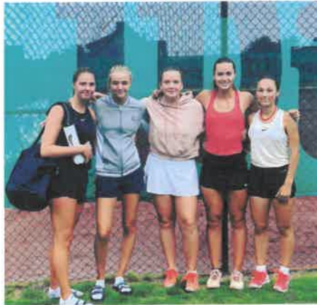
JSM Slutspelet i Båstad 2019 med 5 MIK representanter