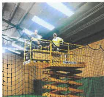
Bilder från uppsättning av den nya belysningen

Finansieringen av projektet löses till hälften ur egen kassa och till hälften i form av lån från några av klubbens medlemmar. Projektet startade under juli månad och beräknas vara färdigt i oktober.