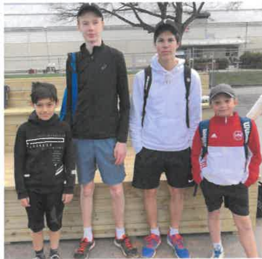
Glada juniorer som deltog i KM 2019